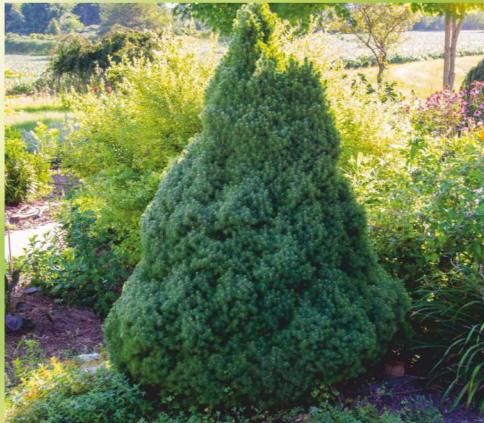
99,- ks PICEA GLAUCA CONICA ø K2 cm, velmi efektní solitér, smrk sivý, 20-30 cm