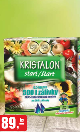
89,- ks KRISTALON START 0,5 kg, univerzální rozpustné hnojivo 178,00 Kč/kg