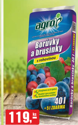
119,- ks SUBSTRÁT PRO BORŮVKY A BRUSINKY 45 l, 2,64 Kč/l