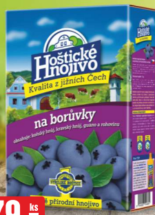
79,- ks HOŠTICKÉ HNOJIVO NA BORŮVKY 1 kg