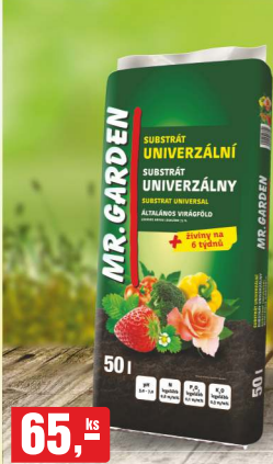
65,- ks UNIVERZÁLNÍ SUBSTRÁT 50 l, 1,30 Kč/l