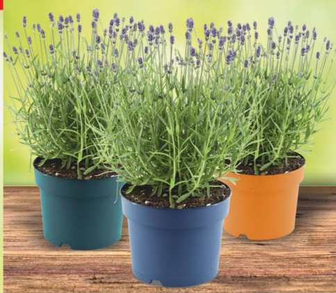
55,- ks LAVANDULA ANGUSTIFOLIA ø K14 cm, levandule úzkolistá