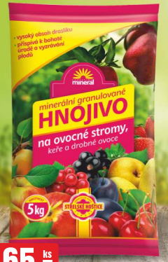
165,- ks HNOJIVO NA OVOČNÉ STROMY 5 kg, 33,00 Kč/kg