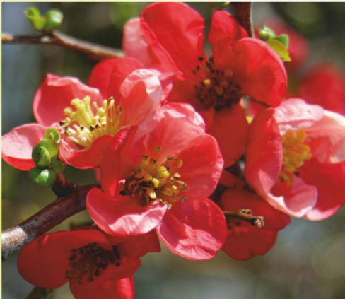
65,- ks CHAENOMELES MIX DRUHŮ ø K2 cm, kdoulevec