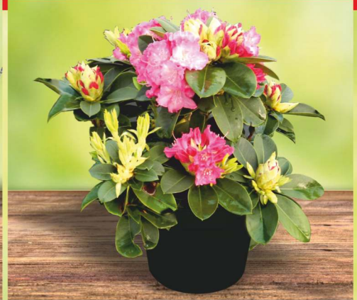
319,- ks RHODODENDRON MIX 5l kontejner