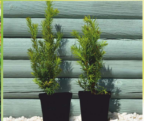
109,- ks TAXUS MEDIA HICKSII ø K3 cm, tis, vhodný do živých plotů, 60-70 cm