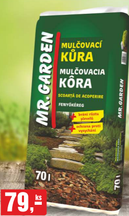
79,- ks MULČOVACÍ KŮRA 70 l, 1,12 Kč/l