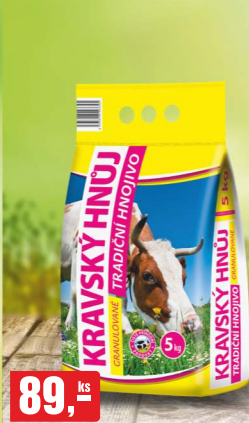
89,- ks KRAVSKÝ HNŮJ 5 kg, 17,80 Kč/kg