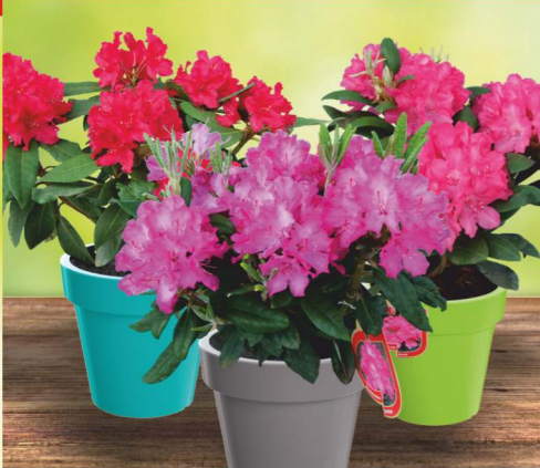
45,- ks RHODODENDRON HYBRIDUM MIX ø K9 cm