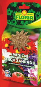
80,- ks Běžná cena: 89,- / ks HNOJIVO PRO CELOU ZAHRA DU 200 g, multicote 6M 445,00 Kč/kg